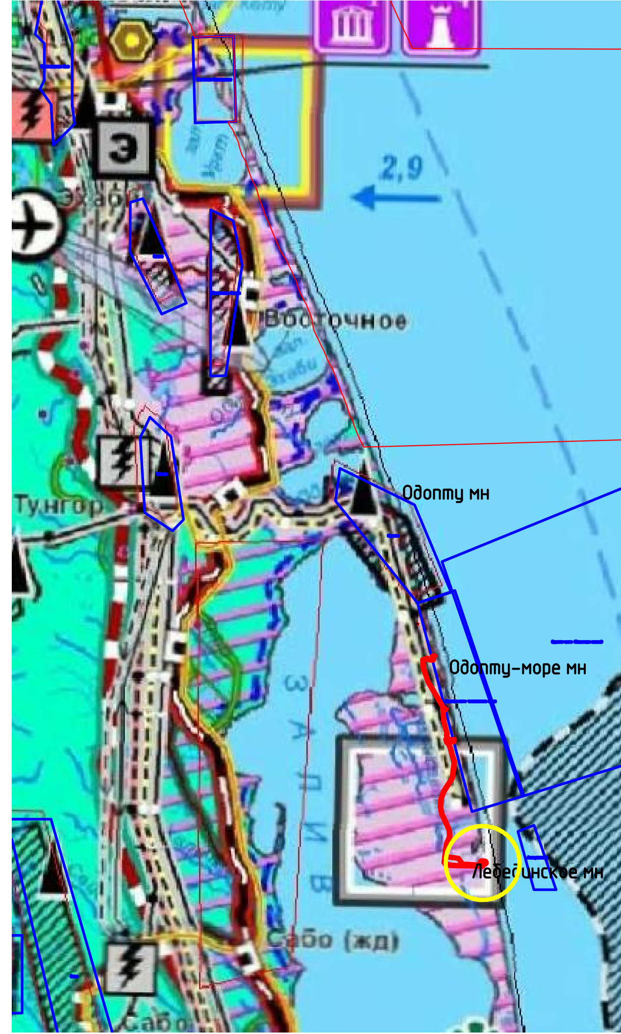
Схема размещения объекта на выкопировке из схемы территориального планирования Сахалинской области. М1:200 000